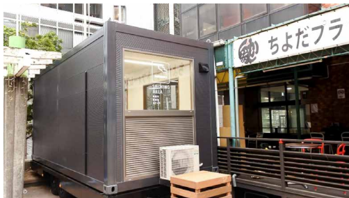
千代田区での導入事例

路上禁煙地区内の路上喫煙や吸い殻のポイ捨てを改善し、 受動喫煙防止を進めるため、本年4月より新しいタイプの喫煙所を開設します。 併せて路上禁煙・ポイ捨て禁止マークを一新します。