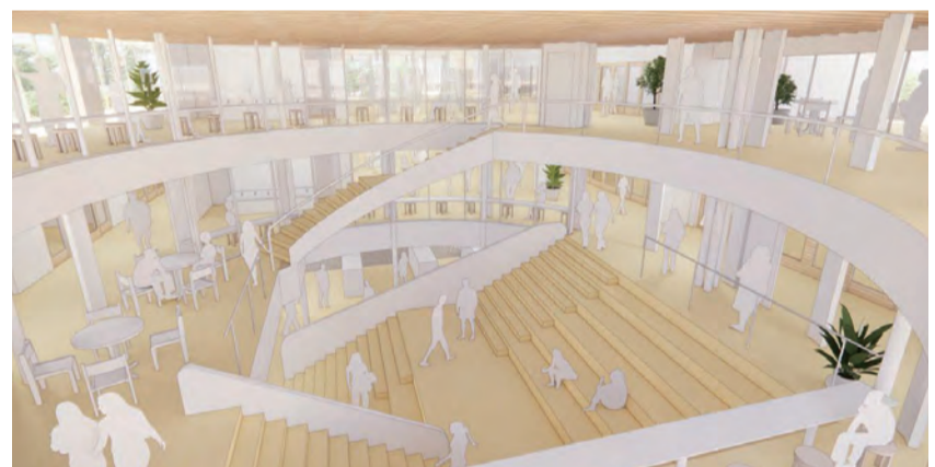
ラーニングコモンズに面した大階段（五中ステップ） ※図は全て現時点でのイメージです