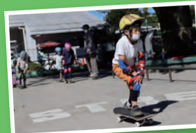
はじめてのスケートボード教室