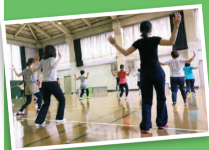
子育て支援スポーツ教室

スポーツの魅力をより深く知る機会やスポーツを始めるきっかけづくりのため、トップアスリートとの交流の機会を提供します。