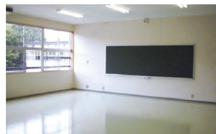
仮設校舎教室内イメージ

令和4年2月より第一中学校・第五中学校の校地内に仮設校舎を建設しています。仮設校舎は冷暖房設備を完備し、音についても工事作業側の窓を二重窓にするなど、児童・生徒が安全で快適な学校生活を送ることができるよう、配慮しています。仮設校舎は令和4年8月頃に完成予定で、令和4年8月末から令和7年3月まで使用します。