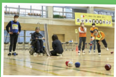
ボッチャ武蔵野カップ