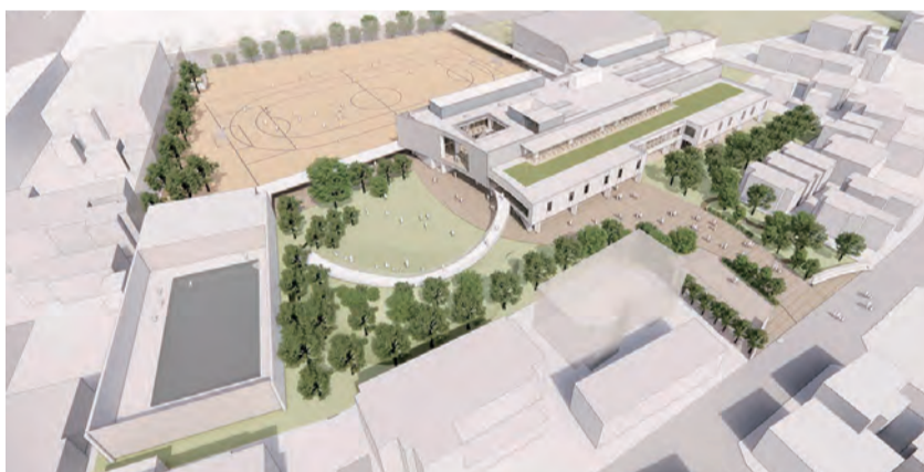
外観鳥瞰図 既存の緑の環境を継承・発展する森に包まれた学校