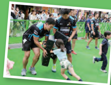
Sports for All イベント