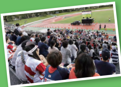
パブリックビューイング