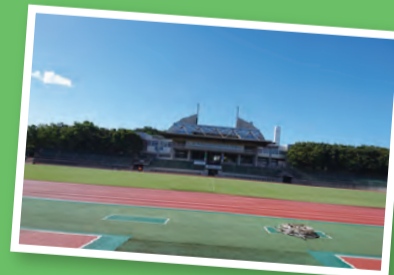
武蔵野総合体育館・武蔵野陸上競技場