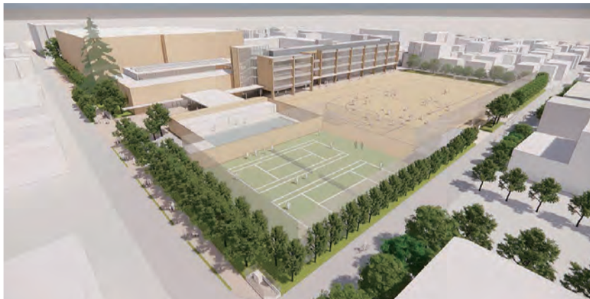
外観鳥瞰図 隣接する中央コミュニティセンター、市民文化会館と連携した中町の魅力を高めるひらかれた学校