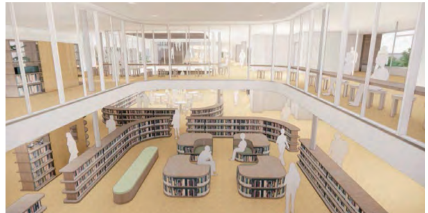
ラーニングコモンズのイメージ