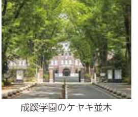
成蹊学園のケヤキ並木

市にゆかりのある方や近隣自治体住民に興味を持ってもらえるよう、返礼品には市内27事業者・108品目の商品やサービス(令和元年10月開始時点)を用意しています。寄附者はふるさと納税仲介サイト「ふるさとチョイス」を使って市独自の返礼品が選べます。