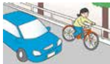
自転車は、車道が原則、歩道は例外

自転車の交通ルール・マナーの周知と事故防止のため、全自転車利用者の受講を目指して開催しています。(既受講者4万3000名超) / ☎交通対策課 60-1860