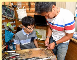
▲まずは見本を見せていただく。

シルバーのパーツと革ひも、ビーズを組み合わせ、シルバーチェーンに通してオリジナルのネックレスを作ります。組み合わせ方にセンスが出る！