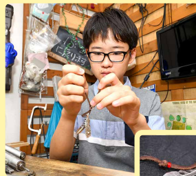
▲革ひもは、軟らかく扱いやすい鹿革を使う。