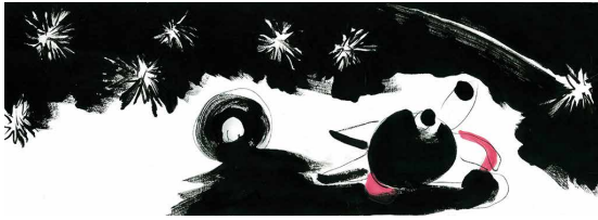
『くろ』(武蔵野市立吉祥寺美術館 2019年) © Chiki Kikuchi