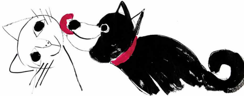
『しろとくろ』(講談社 2019年) © Chiki Kikuchi