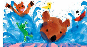
『ババおふる』(文溪堂 2017年)