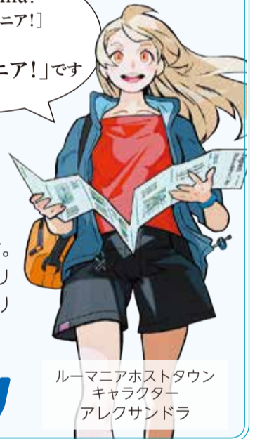
ルーマニアホストタウン キャラクター アレクサンドラ

武蔵野市はルーマニアのホストタウンです。さまざまな交流を図りながら、東京2020オリンピック・パラリンピック競技大会を共に盛り上げていきます／ 問 交流事業課 ☎60-1806