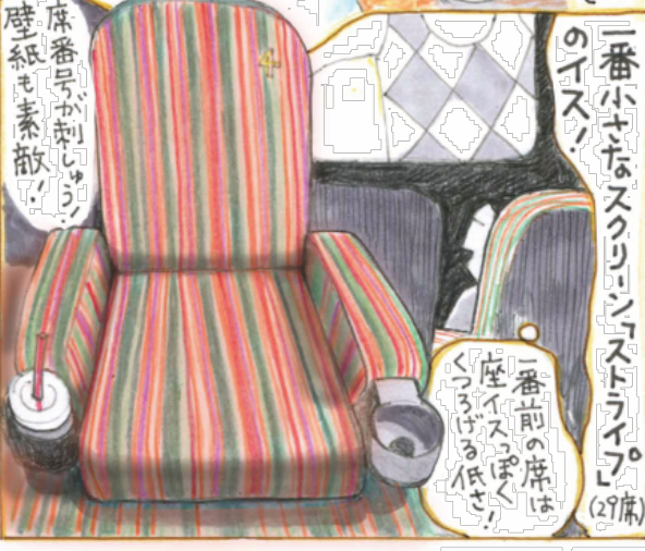
一番前の座は座イスっぽくくつろげる低せ!