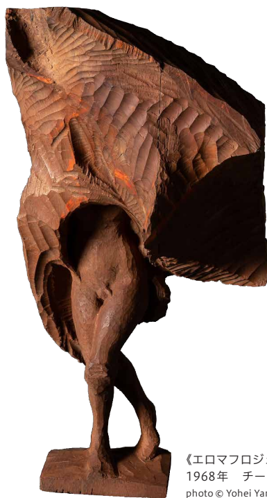
《エロマプロジェクト》 1968年 チーク

アール・ブリュットとは、「生の芸術」と表され、既成の表現法にとらわれずに独自の方法と発想で制作された美術作品のことです。武蔵野アール・ブリュットは市民協働によって作り上げるアート展です。武蔵野市にゆかりのある人たちが出展・参加することで、アートを通して多様性を大切にする地域づくりを進める取り組みです。