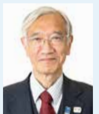
平成6年成蹊大学工学部教授、16年市社会教育委員、23年武蔵野生涯学習振興事業団理事。27年4月より現職。69歳。任期:平成35(2023)年3月31日まで