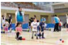
パラ種目ポッチャにチャレンジ 注目選手も来場予定

4月29日(祝)午前10時～午後3時30分(受付午前9時50分～午後3時)／総合体育館、陸上競技場、卓球室、室内プール／市内在住・在勤・在学の方／一日楽しく遊べるニュースポーツイベント／無料／運動のできる服装で、体育館用の靴を持参／車での来場不可／共催：市スポーツ推進委員協議会／☎当日、直接会場へ／☎生涯学習スポーツ課 ☎60-1903