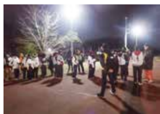
ナイトハイク多摩湖到着

西久保コミセンは、年間事業の中に地域の他団体とタッグを組んで実施する活動がいくつかあります。恒例の「多摩湖往復ナイトハイク」、「夏祭り」、「コミセンまつり」、「学習会」、「フリーマーケット」、「クリスマス会」、「コンサート」など。