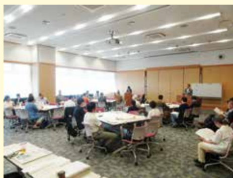
平成29年5月21日市民との意見交換会

本年8月、議会運営委員会において、議会基本条例素案をまとめ、本年度中の制定を目指しています。