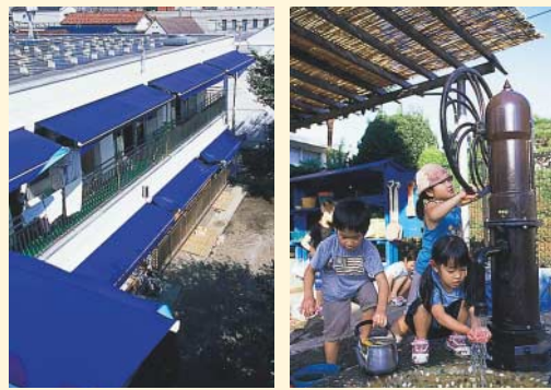
▶子どもたちがクーラーのない自然環境で、より涼しく過ごせるように保育園の「涼」環境づくりに取り組んでいます。

決算特別委員会は9月15日、委員11名からなる決算特別委員会を設置し、正副委員長を選出しました。決算の審査は、9月16日から22日までの実質4日間で行われました。一般会計及び4特別会計の歳入決算総額、866億602万7千円、同歳出決算総額、846億3,943万4千円で19億6,659万3千円が翌年度へ繰り越されました。また、水道事業会計の収益的収入及び支出は、収入36億3,505万7千円、支出32億2,415万2千円で、差し引き4億1,090万5千円の純利益となりました。