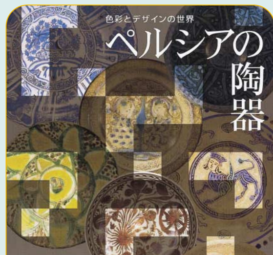
▲武蔵野市と三鷹市との相互活動支援により、展示品の一般公開を再開した中近東文化センター(三鷹市大沢3-10-31)。日本における中近東文化研究の中心的な存在であり、学校教育を初め生涯学習や市民活動で活用されています。現在行われている「ペルシアの陶器」展は市民の方(証明書必要)は入場料100円でご覧いただけます。

9月30日～10月4日に議長以下10名の議員団が本市と職員派遣研修協定を締結している韓国忠州市及びソウル特別市江東区を表敬訪問しました。また、忠州市で開催され、今年で第7回目を数える世界芸術祭の開幕式に参列しました。