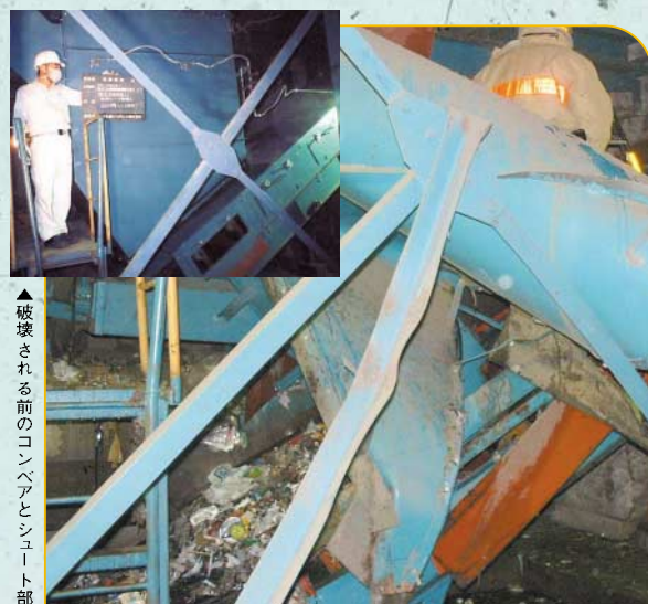
▲爆発により破壊されたコンテナとシュート部分。9月28日、グリーンセンターの爆発。不審ごみ処理施設内で爆発事故がありました。原因は、使い切っていないガスボンベなどが混入していたものと考えられています。ごみは正しく出すようお願いします。