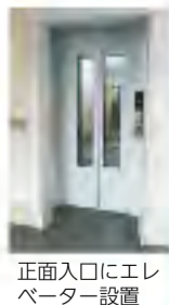
正面入口にエレベーター設置

リニューアルオープンに伴い、エレベーターが設置され、これまで以上に便利にご利用いただけるようになります。地域交流の拠点として皆さんに愛されるコミセンを目指し、運営委員・協力委員一同、頑張っていきます。みんなで地域の輪を広げていきましょう。