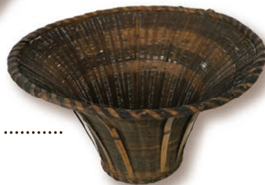
じょうご(くれいすかし) …………… 子どもがお菓子を食べすぎると 「くれいすかし」と怒られました