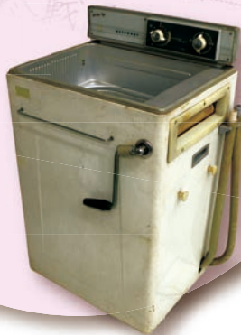
……… ローラー式洗濯機 脱水をローラーで行いました