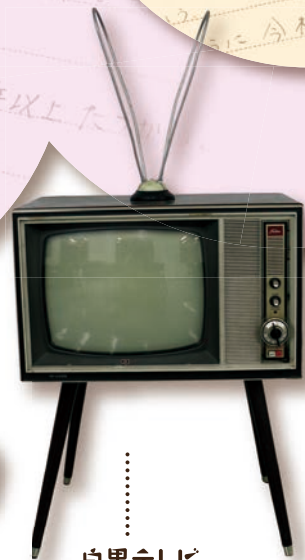
白黒テレビ 画面横のダイヤルで チャンネルを変えます