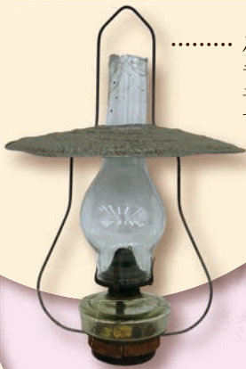
……… 石油ランプ ランプ磨きは 子どもの仕事 でした

くらしのどうぐがたくさん収蔵されている武蔵野ふるさと歴史館。 しかし、どうぐだけを見てもどのように使っていたのか、どのようにくらしていたのかははっきりとわかりません。 しかし、それを知るための手がかりは幾つもあります。それは本のなかにあるかもしれません。 何十年も前に撮影した写真の中に隠れているかもしれません。 そして、それは、身近な人の「語り」の中にあるかもしれません。 今回の企画展では、明治・大正期にうまれた人たちの「語り」から どうぐのうつりかわりやくらしのうつりかわりをみていきます。