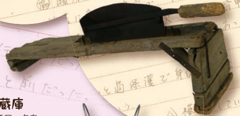
押切 糞などを切って、肥料に しました