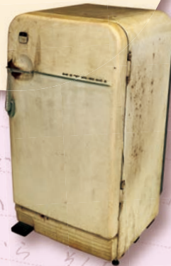
……… 冷蔵庫 足でロックを はずします