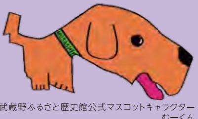
武蔵野ふるさと歴史館公式マスコットキャラクター むーくん