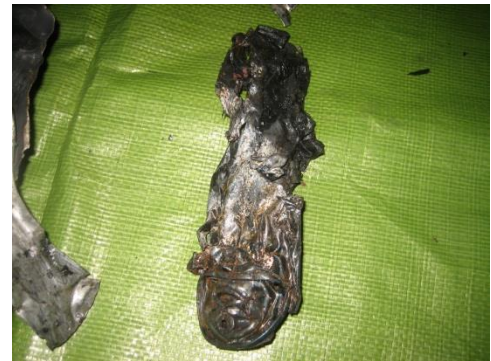
燃えがらから発見された 卓上カセットコンロ用ガスボンベ