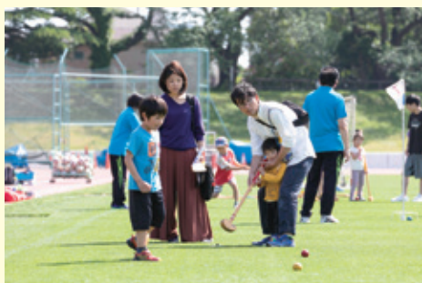
グラウンド・ゴルフ