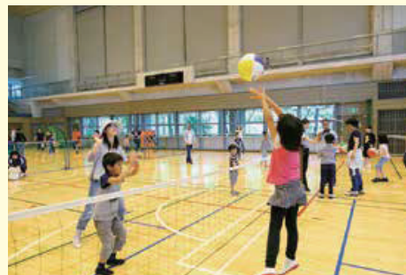
ソフトバレーボール