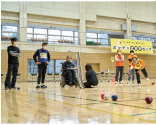
ボッチャ武蔵野カップ

みなさん、パラリンピックはボッチャに釘付けではなかったですか?日本勢は個人で金、ペアで銀、チームで銅と大活躍。ボッチャの面白さに魅了された方も多かったのでは?実は私たちがスポーツ推進委員は、日本代表チームのキャプテンにして東京2020の金メダリスト(個人)杉村英孝選手に直々でボッチャを教わったことがあるんですよ!これってすごくないですか?前回のリオ・パラリンピックで銀メダルをとったあと、いまから4年前、武蔵野市の体育館に来ていただき教えてもらいました。「細かいルールはおいておいたとしても、とにかくボッチャの面白さを知ってください」との言葉で、