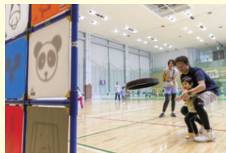
ディスゲッターナイン