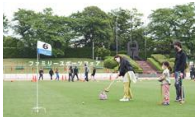
グラウンド・ゴルフ