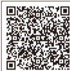
【申込フォーム】はこちら