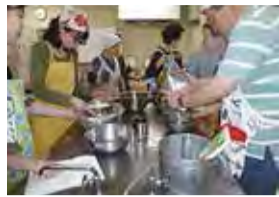
シフォンケーキ教室(中央コミセン)

大型館の中央コミセンと小型館の中町集会所、この二つの施設を運営しているのが中央コミュニティ協議会です。どちらもさまざまな活動ができる特色のある部屋を備えていますが、特に中央コミセンは本格的な茶室や調理室などがあります。最大38人が利用できる広い学習室は、学生だけでなく一般の方の利用も増えています。またピアノのある部屋が2つあり、楽器演奏やコーラス、ダンスなどに利用されています。防音設備はありませんが、利用者の方々がお互いに協力しながら利用してください。