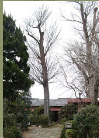
杉並上井草に保存されていた古民家と400年経つケヤキの貴重木

お申込み方法 11月30日(木・必着)までに往復はがき・Eメール・または直接武蔵野ふるさと歴史館にてお申込みください。