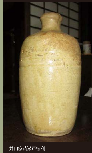
井口家黄瀬戸徳利