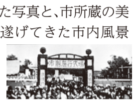
市制施行記念式典 昭和22年

10月28日(土)~11月5日(日) / 午前10時~午後5時 / 市民文化会館展示室 / 市が70年にわたり記録してきた写真と、市所蔵の美術作品を一堂に展示。大きく変貌を遂げてきた市内風景と、市ゆかりの芸術家・文化人の仕事をあらためて紹介します / 無料 / 固秘書広報課 ☎60-1804、吉祥寺美術館 ☎22-0385