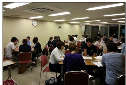
▲グループワークの様子

平成 28 年 6 月 21 日、高齢者総合センターで行われた「第 1 回地域包括・在宅介護支援センター研修会」において、在宅医療介護支援室の活動実績の報告が行われました。研修会には、市内 6 力所の地域包括・在宅介護支援センター職員と市役所にある基幹型の地域包括支援センター職員約 40 名が参加し、実績報告後、「支援室の相談事例を通して、地域包括・在宅介護支援センター相談業務（役割）を考える」をテーマにグループワークを行い、支援室の活用方法について検討しました。