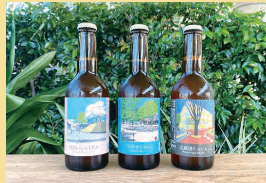
左から「関前セッションIPA」「吉祥寺エール」「武蔵境ペールエール」。それぞれの収穫地の生ホップを使用した限定商品。

武蔵野市産ホップをブレンドした通年向けの「みんなのレールエール」。「レール」とは高架下の醸造所であることからの命名。「26Kブルワリー」は武蔵境駅北口から西へ徒歩7分、カフェやショップを併設する「Ond武蔵境」境南町3-2-13(高架下)の一角にあります。