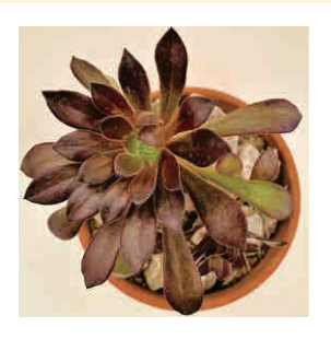
アエオニウム 黒法師

春から梅雨までは日当たりの良い戸外で育て、夏は風通しの良い半日陰へ。冬は室内に取り込み、3月頃より外へ。