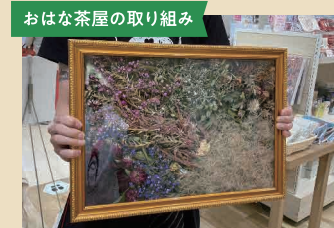
おはな茶屋の取り組み お店で売れ残った花をドライフラワーに変えて、違う魅力を引き出し消費者に提案する活動をしている。