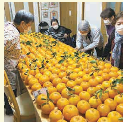
見事な夏みかんが収穫出来ました。収穫量も当初より増えているそうです。

施設名になっている金木犀とともに、夏みかんの木もシンボルツリーになっていて、毎年ひな祭りの時期に夏みかんの収穫祭を行っています。みなさん楽しみにされていて、今年は456個もの収穫がありました。みずみずしくて美味しいと評判の夏みかんです。マーマレードを作られる方もいます。「きんもくせい」の庭には、利用者の方が提供して下さったフクジュソウ、サクラソウ、ゼラニウム、コウテイダリアなど一年を通して様々な花が咲きます。種蒔きを手伝ってくださる方もいて、地域の支え合いの庭になっています。