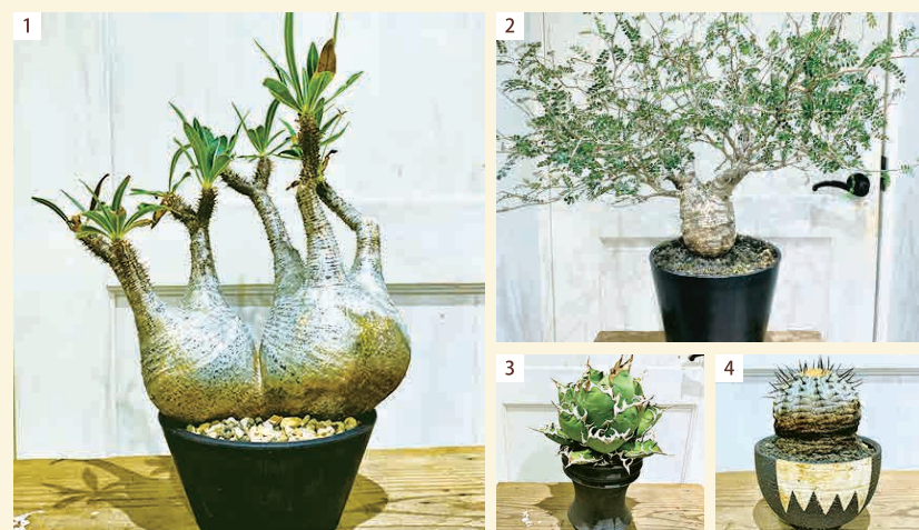
1. パキポディウム・グラキリス (自生地マダガスカル) 2. オベルクリカリア・パキプス (自生地マダガスカル) 3. アガベ・オテロイ (自生地北アメリカメキシコ) 4. サボテン・コピアポア (自生地チリ)