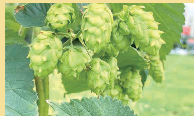
これがホップ。乾燥した気候を好むツル性の植物。試行錯誤を重ねて虫害や発育不良を乗り越え、現在は収穫量も安定してきた。

武蔵野市産ホップをブレンドした通年向けの「みんなのレールエール」。「レール」とは高架下の醸造所であることからの命名。「26Kブルワリー」は武蔵境駅北口から西へ徒歩7分、カフェやショップを併設する「Ond武蔵境」境南町3-2-13(高架下)の一角にあります。