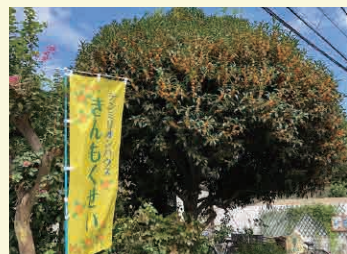
施設名にもなったシンボルツリーの金木犀。

「きんもくせい」の周辺には緑が多くみなさん連れだってお花見を兼ねて散歩を楽しまれています。