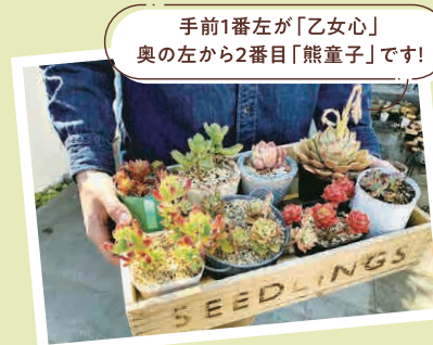
手前1番左が「乙女心」 奥の左から2番目「熊童子」です!