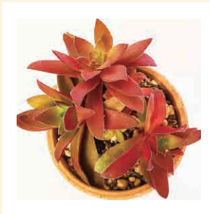
クラッスラ 火祭り

春から梅雨までは日当たりの良い戸外で育て、夏は風通しの良い半日陰へ。冬は室内に取り込み、3月頃より外へ。