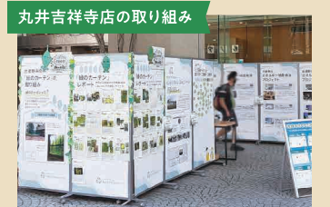
丸井吉祥寺店の取り組み 店頭や店内のスペースを活用し、武蔵野市の環境に配慮した活動の紹介や、サステナブルを目指すイベントを開催している。