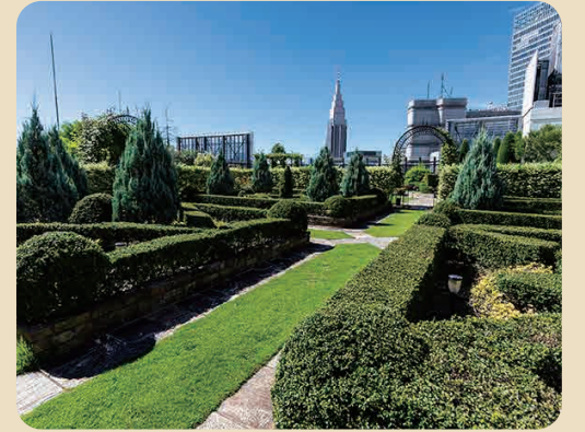
新宿マルイ 本館の「Q-COURT」 2009年に「都市の中で美しい緑の景観を創り、存続させ、広げていきたい」というコンセプトで屋上につくられました。2014年から、「SEGES都市のオアシス」(主催:公益財団法人 都市緑化機構)に認定されている。

サステナブル(持続可能)な事業展開を目指しているグループ全体の中で、丸井吉祥寺店では2019年には再生可能エネルギー100%を実現。さらに独自の取り組みにより、武蔵野市ごみ減量資源化推進事業者「Ecoパートナー」に4年連続で認定されています。また取引先と協力しながらイベントやワークショップなどで環境に配慮した暮らしを提案するなど、地域住民に身近な活動も行っています。