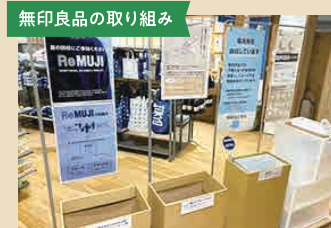
無印良品の取り組み 役割を終えたモノの行く末を考え、使用済みの無印良品の商品を、店頭にて回収している。