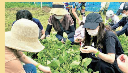
市内では吉祥寺東町3丁目の「清水農園」、「武蔵境駅」、関前3丁目の「大坂農園」、「垂細亜大校内」の4か所でホップを育成中。

また製造過程で出る廃棄麦芽活用を地元の日本獣医生命科学大学の研究室と共同で研究、飼料としても活用しているそうです。