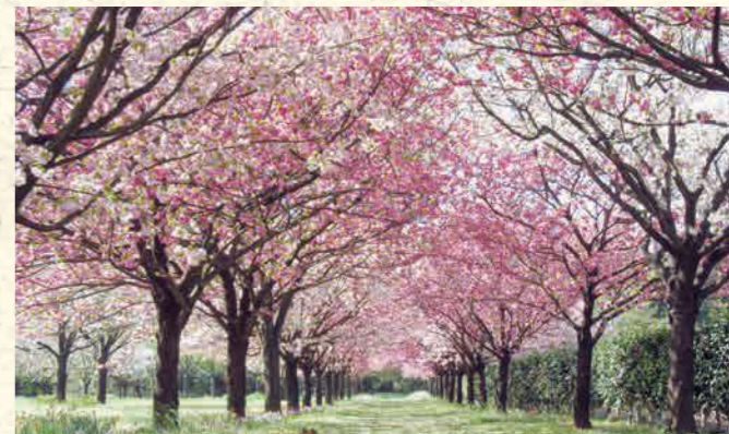
桜見本園 10品種の桜が一斉に開花する「十色桜の並木」(4月)