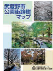
平成27年度版の表紙。 本年度改訂版は4月1日頃に 発行予定。

『武蔵野市公園街路樹マップ』をご存じですか? 武蔵野市が管理する、公園・緑地、街路樹の樹種などを掲載した地図です。前回の改定版から8年が経過し、現在最新版への改定を行っています。マップの裏面には、複合遊具や防災施設のある公園などが一覧にまとめられ、利用目的から探すこともできます。