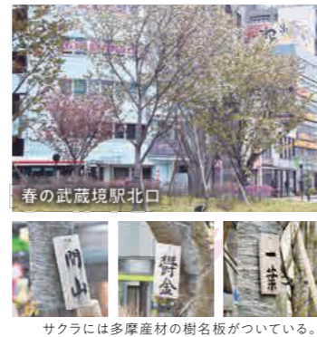
サクラには多摩産材の樹名板がついている。

「桜前線」の話題が出始めると少しソワソワしてきますね。この桜前線の基準になっているのは、染井吉野です。でもじつはサクラは、ひとくりにできないほどたくさんの種類があり、日本には600を超える品種があるそうです。花の色は染井吉野のような薄いピンクだけでなく、濃い赤や白や黄緑色もあり、花の形も様々。開花期も幅広く、長く楽しめます。そんなサクラの奥深く多彩な魅力を、公益財団法人日本花の会に教えていただきました。