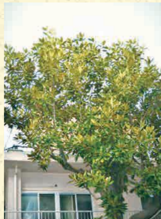
樹齢およそ80年のマグノリア。夏には大きな木蔭をつくる。

みどりの癒しと穏やかな環境の中で子どもたちは成長し、マグノリアに見守られて、今年も旅立っていきます。