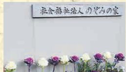
50名の子どもたちに対してスタッフは36名。温かくきめ細かなケアに子どもたちは守られています。