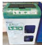
紙パック回収ボックス

紙パックは、市役所、中央市政センター、商工会館1階、市民会館、各コミセンなどで専用の回収ボックスを設け回収し、資源化しています。飲み終わった紙パックを水で洗い、切り開き、よく乾燥させてから回収ボックスへ。食品トレイ、ペットボトル、缶なども、一部スーパーが専用の回収ボックスで回収している場合がありますので、ぜひご利用ください。