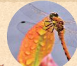
アキアカネ 木の花小路公園

有名なケヤキの並木は四季を通じていつでも味わいがあるが、秋は特に人気。グラウンドの秋景色もいい。