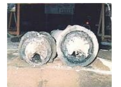
古い下水管に付着した油などの塊

台所は海への入り口です。家庭での小さな心がけが良好な水環境や地球環境を守ることにつながります。みんなで気をつけましょう。