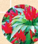
トウガラシ 武蔵野地域

お散歩心得 ※本マップは、公共の緑地にある木を中心に紹介しています。 ※マップ上の樹木や葉のイラストはデザインとして楽しんでいただくもので、樹種による違いや本数を示しているものではありません。 ※数年からの調査ですので、倒木などによる状況変化の可能性があります。 ※道から見える民有地も含まれています。敷地内には許可なく立ち入らないでください。