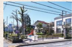
さわやか公園（吉祥寺北町3-15）

親水や自然とのふれあいの場として、散策路や水面を望むことのできる展望デッキなどの整備を行いました。