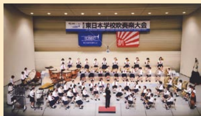
第三小学校吹奏楽団(東日本学校吹奏楽大会)

9月2日、府中の森芸術劇場で行われた全日本吹奏楽コンクール予選「第52回東京都吹奏楽コンクール」小学校の部では、第三小学校吹奏楽団が金賞、第一小学校と関前南小学校の吹奏楽クラブが銀賞を受賞しました。また、9月9日、昭和女子大学人見記念講堂で行われた同コンクール中学校の部では、第三中学校吹奏楽部が銀賞を受賞しました。