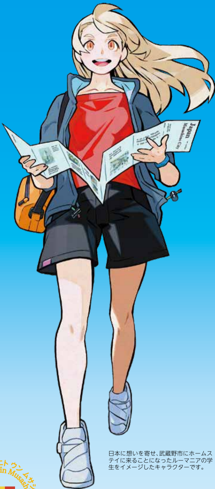
日本に想いを寄せ、武蔵野市にホームステイに来ることになったルーマニアの学生をイメージしたキャラクターです。