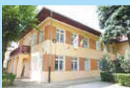
日本武蔵野センター

1998年には、ブラショフ市に交流・協力の拠点として「日本武蔵野センター」を設置しました。市から派遣している日本語教師による日本語教室や日本の行事や文化を体験できるイベントを開催しているほか、図書室などがあり、日本に興味をもつルーマニアの人たちが通っています。