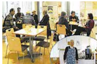
ロビーでの珈琲サービス

リニューアルオープンから早5年、以前の八幡町コミセンにはなかった念願のロビーで数多くのイベントを行ってきました。中でも、毎週土日に開催する50円珈琲サービスは大変人気があり、ボランティアによるいれたての珈琲を3年間で延べ約4千名もの方々に楽しんでいただきました。