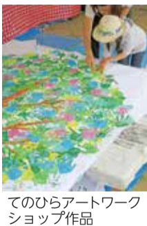
てのひらアートワークショップ作品

7月19日(水)~28日(金)/午前8時30分~午後5時/市役所正面玄関ショーウィンドー/武蔵野ファミリーフェスタ5.3で、みんなの手形で作ったカラフルな作品を展示します/☎秘書広報課 ☎60-1804