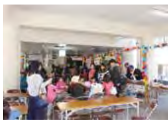
昨年の文化祭模擬店の様子(ピロティにて)

当コミセンには1階の東側にピロティという柱でできた外部空間があります。ほかのコミセンにはないこのユニークなスペースは、文化祭では焼き鳥やわたあめなど模擬店の会場となり、楽しい飲食と憩いの場所になります。そのほかにも、天井があるため、近くの幼稚園の登・降園時の集合場所や雨天時の子どもたちの遊び場所、消防訓練、ガーデニング教室、土・油の回収や地域のイベントの開催など、さまざまな用途で皆さんに広く利用していただいています。