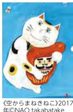
《空からまねきねこ》2017年©NAO takabatake