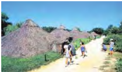
岩寺洞遺跡(江東区)

8月3日(木)~5日(土)2泊3日/羽田空港集合・解散/ホテル:ツイン利用(男女別相部屋)/市内在住・在学・在勤の18歳以上の方/18名(超えた場合抽選・最少遂行10名)/添乗員無し・市職員随伴/1日目:江東区役所表敬訪問、岩寺洞遺跡見学、2日目:ソウル市内観光(明洞ほか)、忠州市役所表敬訪問、弾琴湖国際ボート競技場見学など、3日目:ソウル市内観光(景福宮ほか)など/事前研修・結団式:6月18日(日)*出席必須。感想文提出あり/4万8000円/■5月15日(必着)までに郵送・ファクスで申込書(市内公共施設に設置。市ホームページから印刷可)を京王観光(株)調布支店担当・福田宛(〒182-0024調布市布田3-1-7池田ビル5階)、FAX042-484-1321へ/☎同社☎042-484-2881(土・日曜、祝日休)、交流事業課☎60-1806