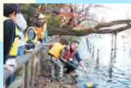
チョコッとかいぼり隊の様子

井の頭池で捕れた生きものを水槽展示します。普段はなかなか見られない池の中をのぞきにきてね。井の頭かいぼり隊と一緒に池に設置しているアメリカザリガニのワナ揚げの体験イベント「チョコッとかいぼり隊」も開催!