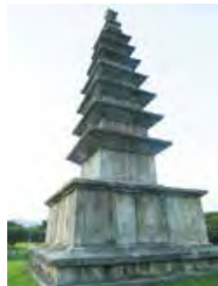
中原塔坪里七層石塔(忠州市)