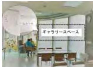
ギャラリーイメージ

本宿コミセンでは明るいガラス張りのロビーに、季節ごとの飾りや年間行事のお知らせなどを展示していますが、今年度から新たに小さなギャラリーを開設することになりました。市民であればプロ・アマ、個人・団体を問わず、出展者がそれぞれ自由に個性を出して使用できるよう考えています。決して広いスペースではありませんが、絵画・書・写真・手芸品など、自分の作品を発表したくても場所やチャンスがなかった方たちにも、ぜひ利用していただきたいと思ひます。