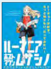
ホストタウンアニメキャラクター

東京2020オリンピック・パラリンピック競技大会に向けて、ルーマニアのホストタウンとして、文化・スポーツ相互交流を行っています。