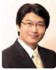
講師:伊藤真 弁護士。伊藤塾(法律資格の受験指導校)主宰。NHK「日曜討論」「仕事学のすすめ」などに出演。

5月20日(土)午後2時30分～4時30分(開場2時) / スイグホール / 180名(超えた場合抽選) / 「くらしと憲法～今こそ『憲法の力』をつけよう!」 / 無料 / 託児: 生後3カ月～未就学児、5名 / 手話通訳あり / 申 5月2日(消印有効)までに電話・ハガキ・ファクス・Eメール(申込要領参照し、希望人数、託児希望は子の生年月日・名前(ふりがな)・性別も明記)で 〒180-8777市民活動推進課 ☎60-1829、FAX51-2000、sec-katsudou@city.musashino.lg.jp へ(入場券を5月10日ごろ送付)。