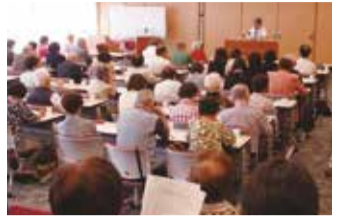
9月30日運営委員研修会の様子

コミュニティ研究連絡会(以下「コミ研連」)では、各コミセンの代表者が集まり月1回定例会を開いています。そのほかにも管外研修、広報研修、窓口研修などいろいろな勉強会を行い、より良いコミュニティづくりのために知識の向上に努めています。