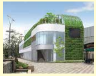
西側からの施設イメージ