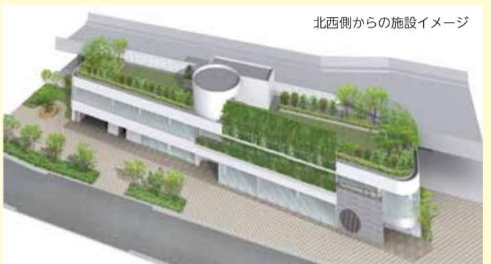
北西側からの施設イメージ

コンセプトは、「人が集まり、にぎわいの生まれる、駅前コミュニケーションスポット」、「駅前広場の緑の連なりと一体化した、うるおいある都市景観の創造」、「老若男女多様な人々が憩い、ふれあい、楽しめる『コト消費*』の提案」です。テナントは、カフェ、小児科・内科クリニック、子ども・シニア向けの体操教室、地元商店と提携した屋上バーベキューなどの内容で、地元と共存した集客・にぎわい形成や子育て支援・健康づくりなどへの貢献が期待できます。地域の特性を踏まえた外観デザインや壁面デジタルサイネージの導入など、全体として事業の目的に沿った積極的かつ優れた提案として評価しました。*コト消費:物を所有するよりも、体験やサービスなどの価値を重視した消費