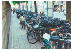
平成6年の吉祥寺駅周辺

10月22日(土)～31日(月)「困ります!自転車置きざり知らんぷり」 / 都内全域 / 放置自転車は、歩行者・車椅子などの通行の、災害時には避難・救出活動の妨げになるとともに、まちの景観を損ねます。自転車駐車場や公共交通機関を利用し、可能な方は徒歩で出かけましょう。一人ひとりがルールやマナーを守り、放置自転車のない安全で美しいまちづくりに協力をお願いします / 問 交通対策課 ☎60-1860