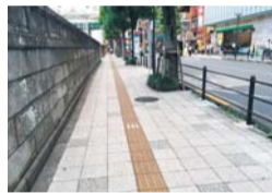
現在の吉祥寺駅周辺