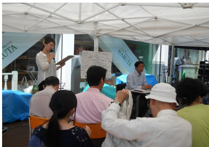
第60回タウンミーティングの様子