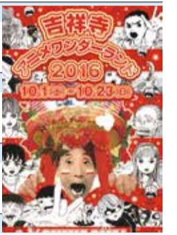
模図かずお/小学館

先行イベント(オカルティック・ナイン展) 9月29日(木)~10月5日(水) /正午~午後6時(5日は午後5時まで) /リベスタギャラリー創/吉祥寺が舞台の新作アニメの原画やサインなどの展示 吉祥寺おもちゃ市場 10月1日(土)・2日(日) /午前10時~午後7時 /荒天中止 /東急百貨店吉祥寺店北側広場 /懐かしいおもちゃ、キャラクター雑貨販売、親子で楽しめるワークショップ まちなかファミリーステージ 10月1日(土)午後0時30分~2日(日)正午~いずれも午後5時30分頃まで /荒天中止 /コピス吉祥寺ふれあいデッキこもれび(吉祥寺本町1-8-16) /ビッグバンドによるアニメ関連の演奏など 森のわくわくステージ(「わくわくバザール」同時開催) 10月8日(土)・9日(日) /午後1時~7時 /荒天中止 /井の頭公園野外ステージ /着ぐるみの登場やアニメソングコンサートなど。たむらぼん、神谷明ほか /森の映画館:午後5時30分~「ふうせんいぬティニー」などアニメ作品上映 「デジモンユニバース アプリモンスターズ」スタンプツアー 10月8日(土)・9日(日) /午前11時~ /井の頭公園本部ブースでスタンプシート配布 吉祥寺アニメーション映画祭 10月22日(土)午後5時30分~8時 /吉祥寺シアター /公募作品の上映・グランプリ発表 /ゲスト審査員:森本晃司(アニメーター) その他ほか 10月1日(土)「なめこ~せかいのともだち」上映会(公会堂) /10月2日(日)「オカルティック・ナイン」先行上映会(公会堂) /10月20日(木)コバヤシオサムのアニメ道(みち)スペシャル(吉祥寺シアター) /「チェブラーシカ」&「ちえり」と「チェリー」上映会(吉祥寺シアター) /10月22日(土)・23日(日)アトリエ「ん」スペシャル公演(吉祥寺シアター)など 【共通】入場無料(一部有料) /内容は変更の場合あり /観覧機構☎23-5900(午前9時~午後6時) .http://kichifes.jp/wonderland/