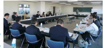
ネットワーク会議の様子