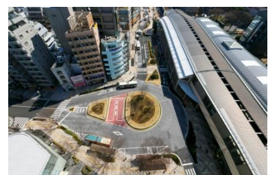
武蔵境駅北口駅前広場再整備