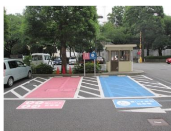
武蔵野市役所思いやり駐車施設