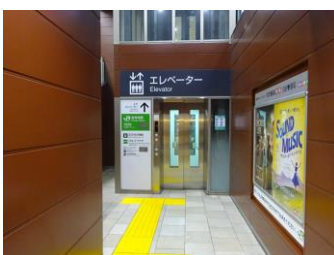
吉祥寺駅エレベーター整備

※各事業の進捗状況を「完了・実施中・検討中・未着手」に整理し、全事業数のうち「完了・実施中」の事業割合を着手率とした。