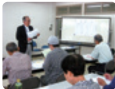
入会説明会の様子

シルバー人材センターに仕事を依頼したい方は、下記事務局までお気軽に電話をください。※原則、武蔵野市内の仕事に限らせていただきます。