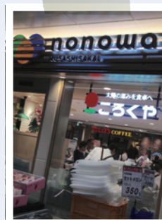
撮影地：nonowa武蔵境