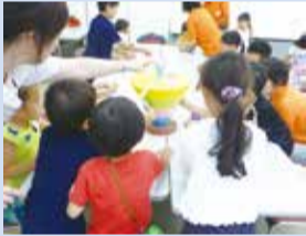
食べ力のびのび教室

●出前で教室を開催します ●親子食育ウォーキング教室、食べ力のびのび教室、チャレンジキッズ教室／健康づくり支援センター ☎51-0793