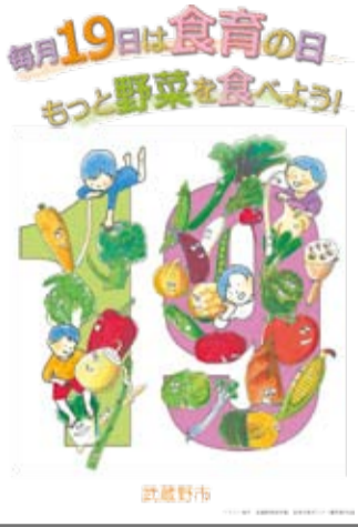
食育月間ポスター (武蔵野美術学園優秀賞作品)

市では、市民一人ひとりが生涯にわたり、心身ともに健康な生活を送れるよう、豊かな「食」を育む取り組みを進めています。多様な食育事業により、皆さんの食卓が楽しくなるよう応援しています。