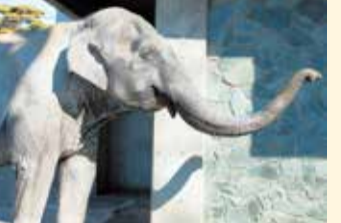
昨年のはな子68歳お祝い会では大勢のはな子ファンに笑顔で応答