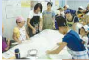
手打ちうどん作り

●夏休み親子教室 食品工場見学、手打ちうどん作り／消費生活センター ☎21-2972