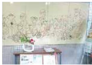
「モニュメント」1.2m×3mの大作です

西部コミセン入口の、タイルでできた大きなモニュメントを皆さんはご存じですか?そこには、本を持つ人、スポーツをする人、お祭りのはっぴを着た人、ベビーカーを押すパママなど老若男女の姿が描かれており、まさに地域の人が集うコミュニティの場所そのものが表現されています。次にいらした時には、ぜひじっくりとご覧になってみてください。