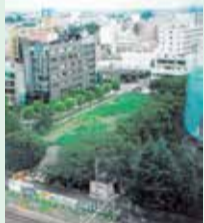
20年前のプレイス所在地

7月26日(火)~31日(日) / 午前9時30分~午後10時 / ギャラリー / 武蔵境地域の歴史を地域映像アーカイブ(本市に関する写真や映像をデジタルデータ化したもの)で振り返るとともに、武蔵野プレイスの歩みを紹介 / 31日はトークセッション(午後2時~3時)あり