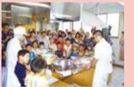
給食・食育振興財団 ☎54-2090

●むさしのマルシェ、むさしの給食食堂、展示教室、展示体験コーナーなど／会場：市民会館／給食・食育振興財団 ☎54-2090