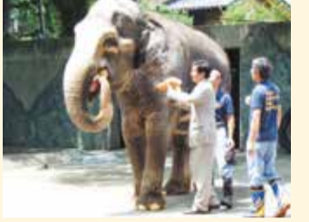
平成19年のはな子60歳お祝いイベント選磨を祝ってパンをプレゼント