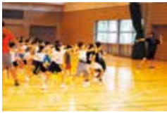
ボールの投げ方教室

幼児①②:平成22年4月2日～25年4月1日生③:24年4月2日～25年4月1日生④:22年4月2日～24年4月1日生/1人1教室/定員を超えた場合抽選/各2500円(幼児ダンスは各2000円、ボールの投げ方は各1000円) / 申・問 6月30日(必着)までにハガキ・ファクス(3頁の申込要領参照し、生年月日、在学・在園者は学校名・学年も明記)または所定の申込用紙(総合体育館で配布)で 同館 ☎56-2200へ。 http://www.musashino.or.jp から申込可。