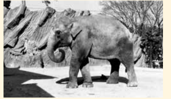
昭和29年井の頭自然文化園に移ってきた頃

60年以上に渡りみんなから愛され、元気や勇気を与え続けてくれたことに感謝し、安らかな冥福をお祈りします。