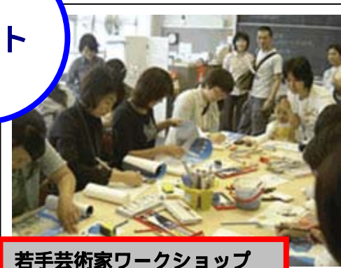
若手芸術家ワークショップ