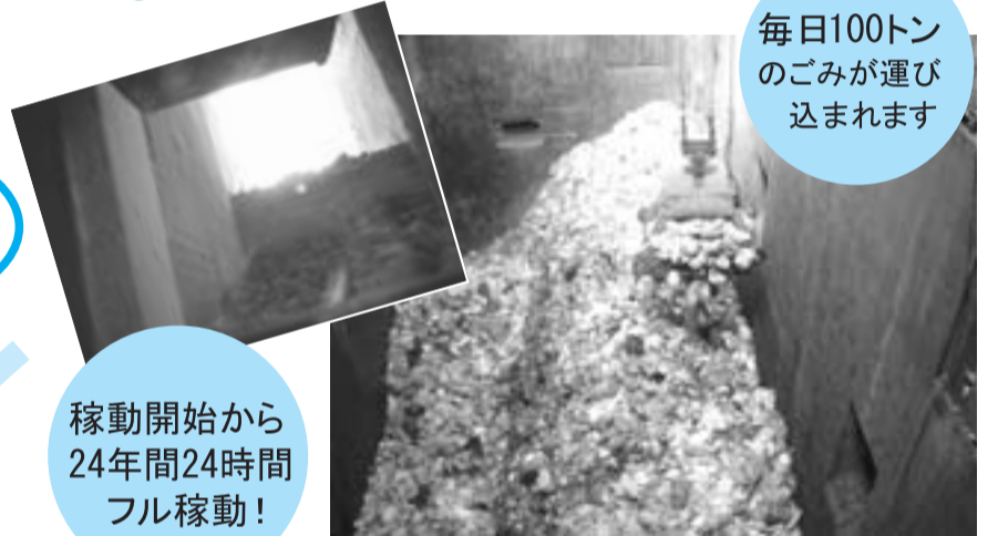
毎日100トン のごみが運び 込まれます