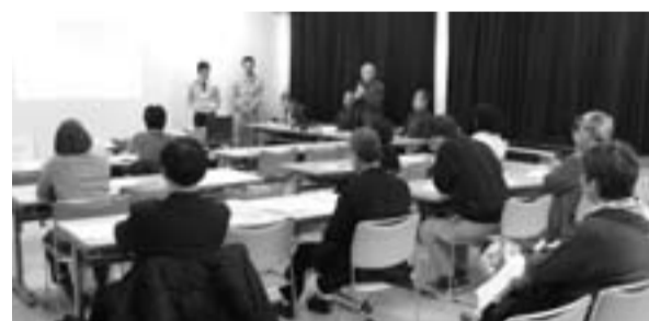
第1回コミセン勉強会の様子