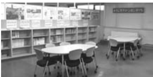
クリーンセンター3階のオープンハウス

クリーンセンター3階。センターの歴史と現状についてのパネル展示、さまざまな資料などを閲覧できます。気軽にお立ち寄りください。