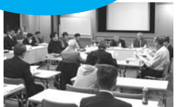
市民参加の(仮称)新武蔵野クリーンセンター施設まちづくり検討委員会は、傍聴もできます(日程は市報などでお知らせします)。