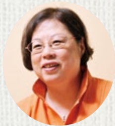
美内すずえ 漫画家