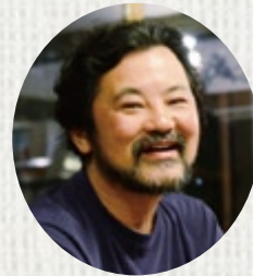
三浦 展 社会デザイン研究者