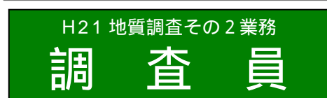
身分証明書と腕章