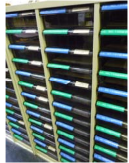
▲引き出し式(鍵なし)

(設問 20) あなたの団体は、武蔵野プレイスにメールボックスがあれば、利用しますか？