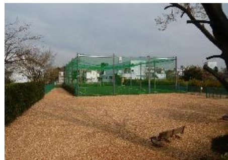
武蔵川公園（ドッグラン併設）

ただ、おっしゃられたとおり、例えば、ドッグランを設ければ、そこに皆さん連れて行って、そこで自由にリードを外したりして、犬にとっても大変楽しい空間になるのではと思いますが、そのドッグランをつくるに際しても近隣の理解というのがなかなか難しいですね。今、市内には境に1カ所ドッグランがございますが、ここから行くにはちょっと遠いかなと思います。