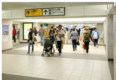
吉祥寺駅南北自由通路

南北自由通路が先月開通いたしました。大変便利になったとお感じになっていると思います。