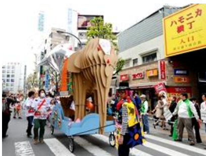
南北自由通路完成記念パレード

もう35年ぐらいこの吉祥寺のまちを愛していて、毎日来ている。ただぶらぶらしても、それだけで何となく楽しくなっている。年だからこういうことを言うのかもわからないが、