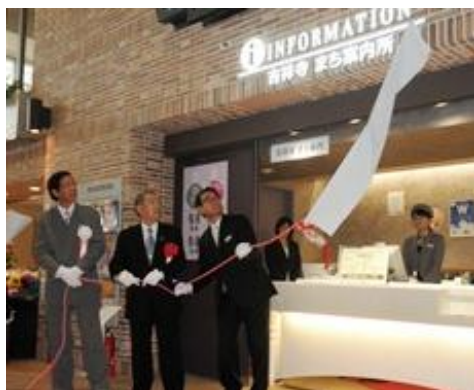
吉祥寺まち案内所 除幕式

今まではサンロードの中に吉祥寺まち案内所があり、サンロード商店街の皆様が中心となって運営されていますが、市でも案内所をつくってほしいということで、アトレ内のはなびの広場に、新たに案内所を作りました。吉祥寺、そして武蔵野市全体をこの案内所で案内をしてほしいということで、人員も補強して運営を始めました。この1カ月間ぐらいで、4,000、5,000件の問い合わせがあり、半分以上が吉祥寺や武蔵野市の施設などのご質問でした。それだけ訪ねてくる方があったということですので、ぜひ利用していただきたいと