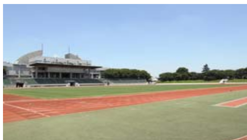
武蔵野総合体育館

まず、市のスポーツ施設を利用する際、市民だと市民カードというのがつくれて、400円のところを200円で利用できますが、住民票がないと、それができません。基本的には住んでいるところに住民票をつくるというのが大原則なので、住民票を移していただければと思います。でも、400円程度で体育館にはプールもジムもあるし、民間のスポーツクラブへ行くよりは利用しやすいと思います。