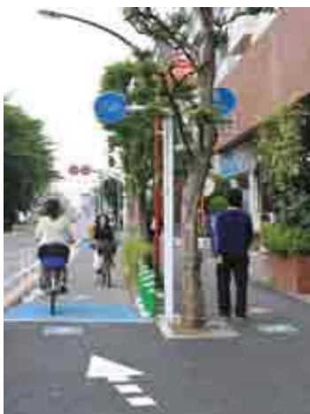
自転車専用レーン

それから、自転車の問題ですが、自転車レーンを国土交通省の道路基準に則ると、なかなか武蔵野市内では自転車レーンをつくれるところがないです。さっき写真で映していただいた、かたらいの道というところについては、あれは独自のルールで、なるべく自転車は端っこを走ってくださいということで、ちょっと色分けをして試行をしています。そういうところをこれから増やしていきたいと思っています。ただ、交通量を考えるとなかなか難しいのが現状です。