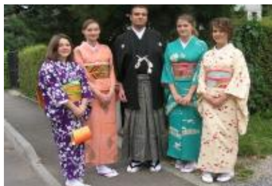
「日本武蔵野センター」着物ショー

これから、2020東京大会に向けてこのブラショフ市があるルーマニア国を武蔵野市として応援し、文化・スポーツ相互交流を実施していきます。