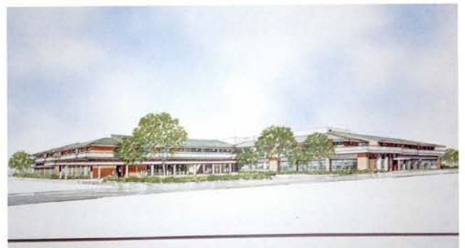
吉祥寺ナーシングホーム（仮称）完成予想図

市内では初めての特別養護老人ホーム「吉祥寺ナーシングホーム（仮称）」（定員50名。在宅サービスセンター併設）を完成させる。引き続き東部地区、西部地区の整備を進め、これにより、市内外合わせて合計300床を確保することを、当面の目標とする。