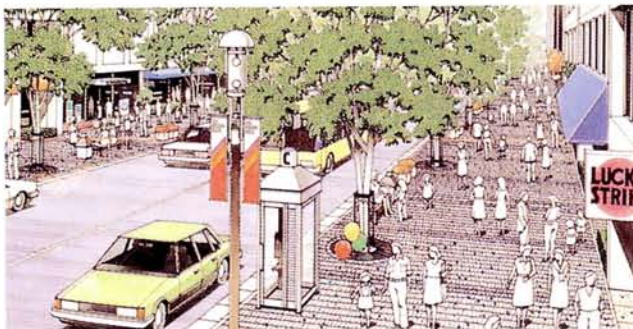
カルチャーモール完成予想図

第一期長期計画からの懸案である本事業は、昭和61年の都市計画決定以来、街路事業、市街地再開発事業、商店街活性化、モール計画、南北自由通路など、着実に成果をあげてきた。今後、完成に向けて精力的に取り組むとともに、さらにJR中央線連続立体交差化事業を促進し、南北一体となった「境らしさ」を魅力とするまちづくりを推進する。