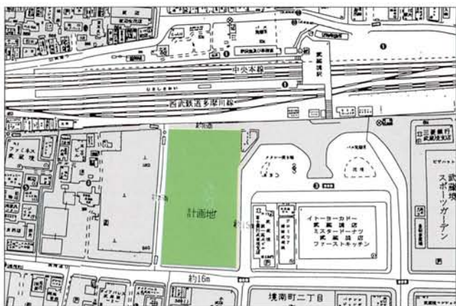
農林水産省食糧倉庫跡地位置図

当用地の取得は、積年の課題として取り組んできた。早期取得を目標に、武蔵境図書館をはじめ、文化活動の拠点となる多目的施設計画を策定する。