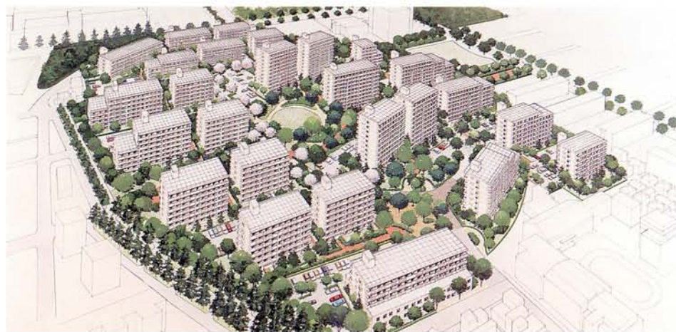
緑町住宅団地完成予想図

現在の商工会館は、建築後30年以上経過し、老朽化したため、改築する。市内商工業の振興の拠点とするとともに、吉祥寺にふさわしい多目的の市民施設を併設し、広く市民の利用を図っていく。