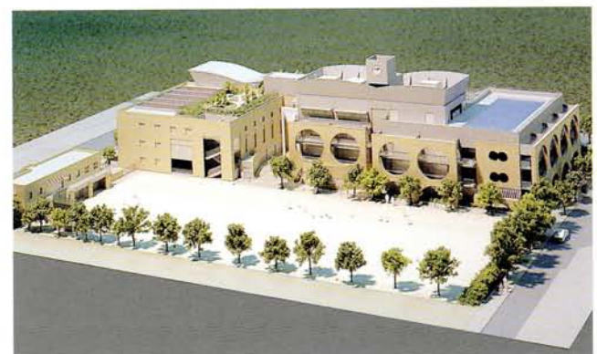
千川小学校完成模型

現在の千川小学校校舎は、昭和42年、蜂の巣校舎として建設されたが、老朽化と使用上のネックを解消するため改築する（同時に、体育館・プールを一体とした改築を行う）。新校舎は、地域への開放を意図した生涯学習対応型、環境や自然エネルギーに配慮した未来型とし、今後の学校整備のモデルとなるものとする。