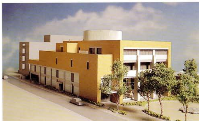
中央図書館完成模型

中央図書館を移転・新築し、本市図書館ネットワークの中核として整備する。蔵書数70万冊のほか、AV関係各種ソフトを揃え、レファレンス機能、ニューメデ