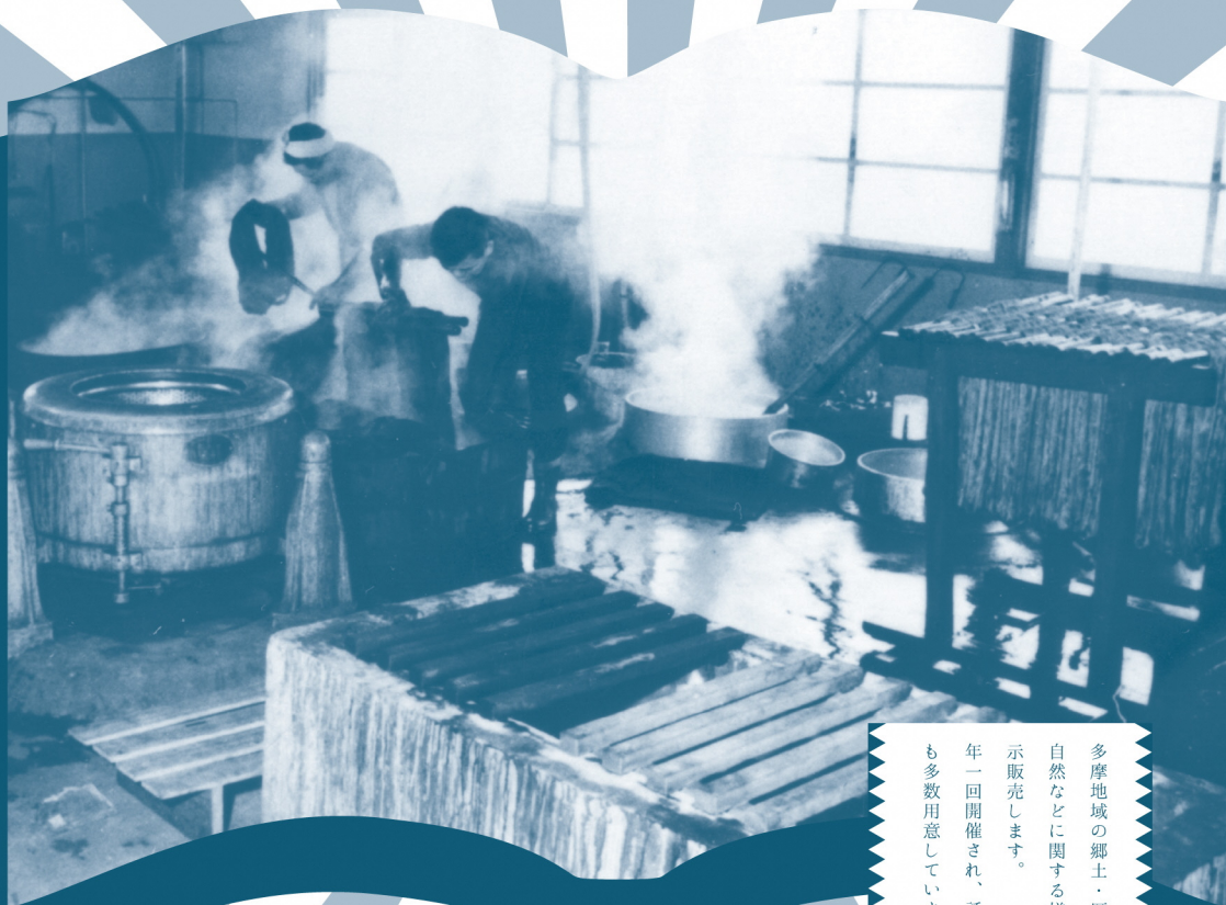
東京都指定無形文化財 村山大島紬製作工程 板締め染色の風景 撮影：武蔵村山市内

多摩地域の郷土・歴史・文化財・自然などに関する様々な図書を展示販売します。 年一回開催され、話題の最新図書も多数用意しています。