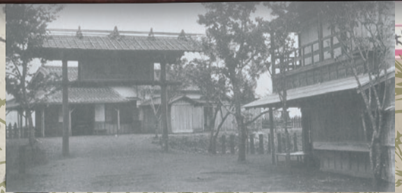
境停車場・凱旋門

入館無料／開館時間：午前9時30分～午後5時／休館日：金・土・祝日（11月3日・12月23日は開館）