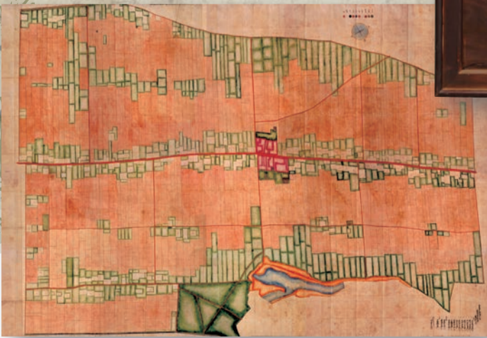
第11大区4小区吉祥寺村全図