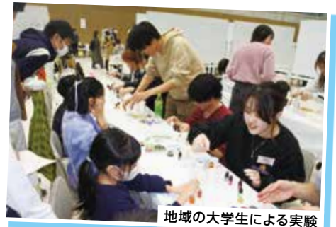
地域の大学生による実験