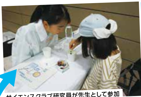
サイエンスクラブ研究員が先生として参加

いろいろな科学の実験を体験してみよう! 科学の不思議や面白さを体験できるブースの しゅつてん ・ てんじ 展示・ てんじ 展示をします。 2025ブース例:「人工イクラを作ろう」「カラーボトルを作ろう」