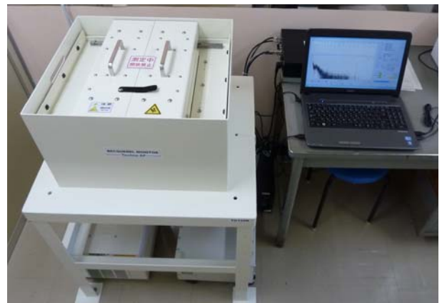
測定結果が自動で出力される