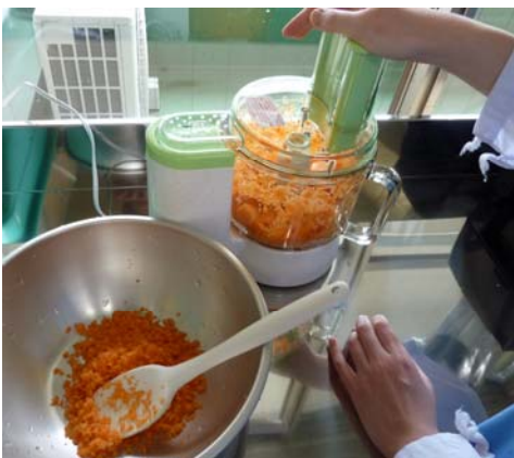
フードプロセッサで食材を細かくする