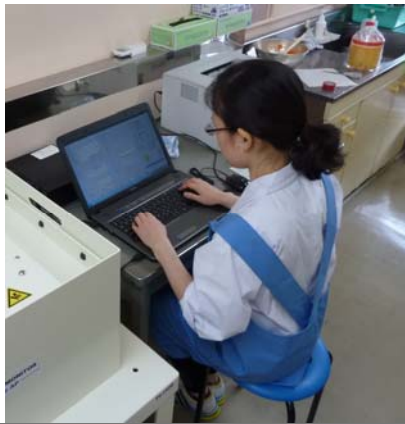
パソコンに重量、測定時間等を入力して測定を開始する