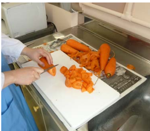
食材は、洗って可食部分を切る