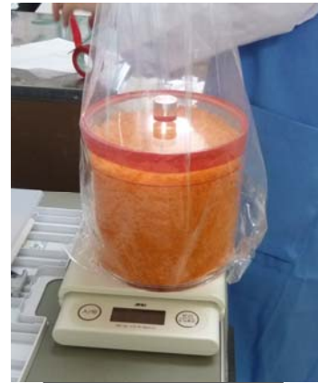
検体の重量を測る