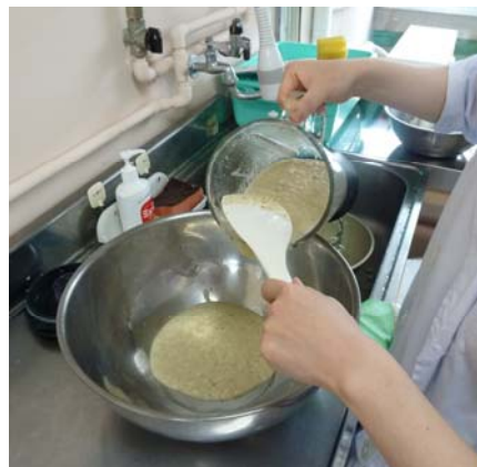
調理済給食は1日分ずつミキサーに かけ、1週間分をボールで混ぜる