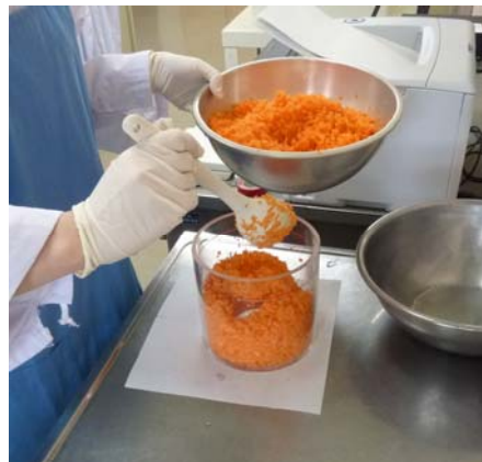
食材、調理済給食を専用容器に詰める