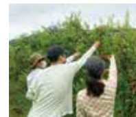
ブルーベリー収穫

夏休みなど長期の休みには農園や卓球大会、他事業プログラムへの参加など 活動時間以外でも同年代との交流機会があります。 詳細はスタッフまでお問い合わせください。